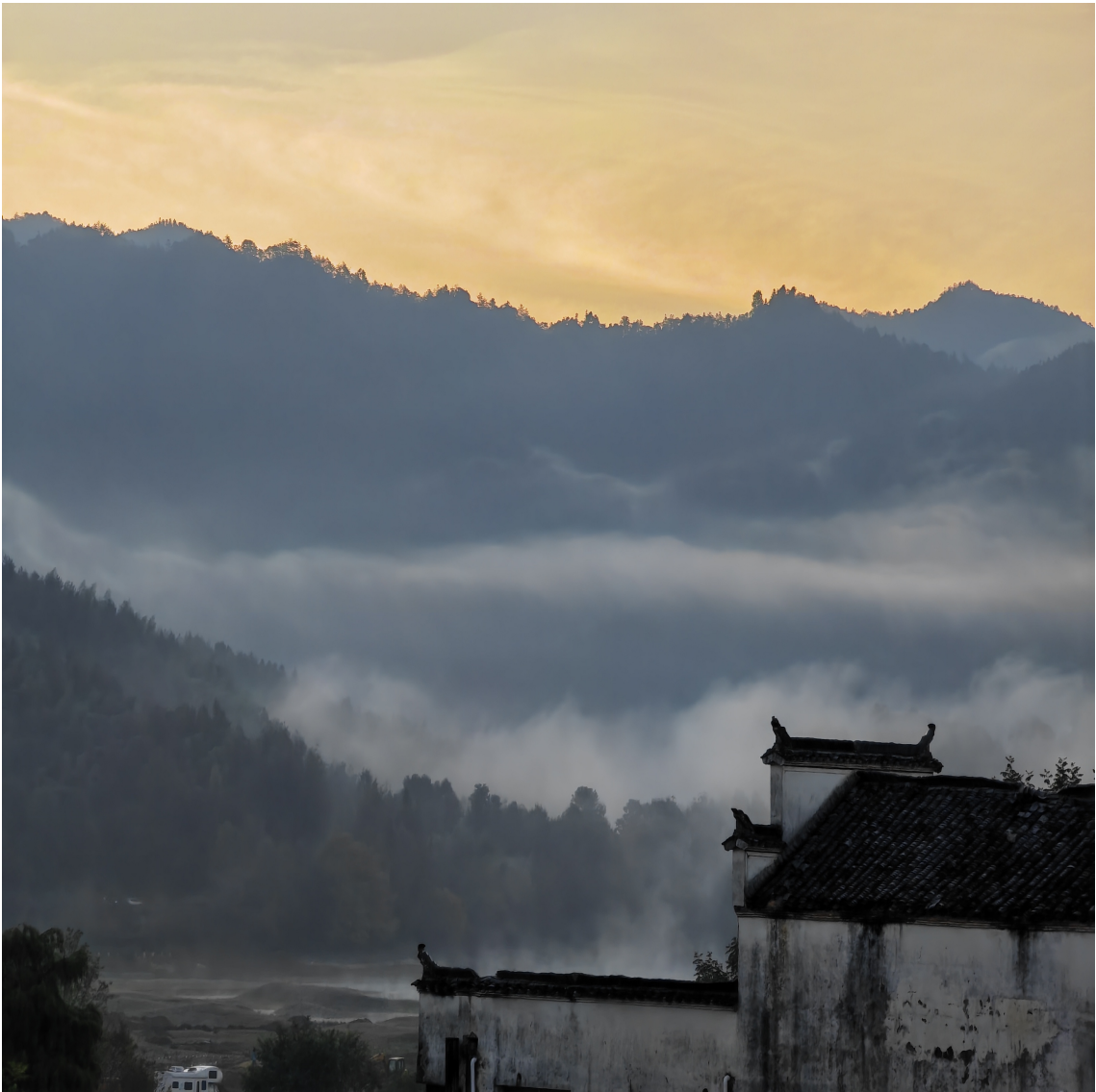
Chaohong Deng, 2024